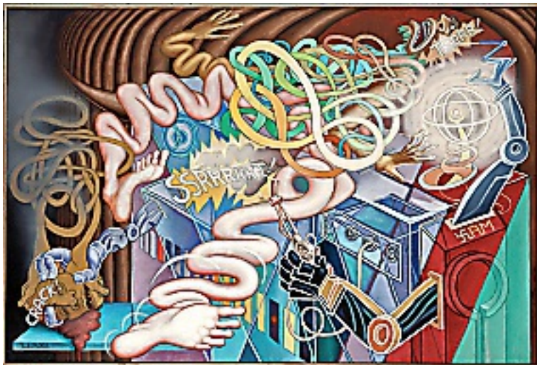
Xam, el Torturador (1983)

Exponente del cómic underground, Zalathiel Vargas rompe todo convencionalismo y aborda la psicodelia y lo sexual