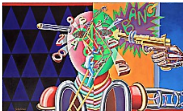
Huir de la realidad (1977)

“En los años 70, Zalathiel es prácticamente la única persona que ha-